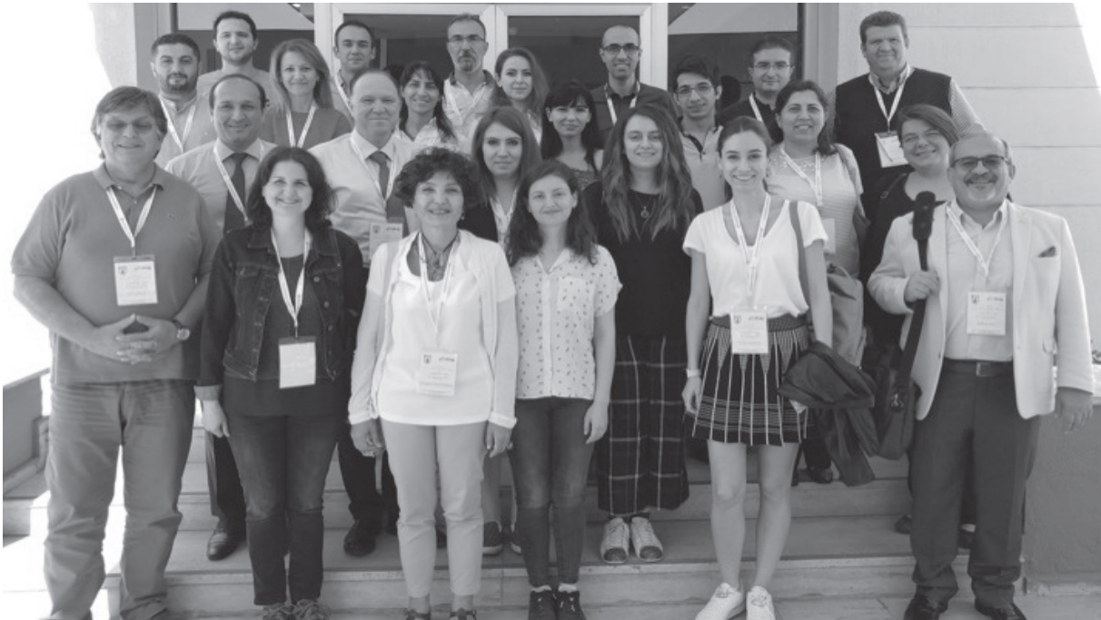
Resim 6. Karın Kolon-Rektum Cerrahisi kursu katılımcıları, Adana, 2017 (Çocuk Cerrahisi Dergisi 31(3):81-88, 2017).