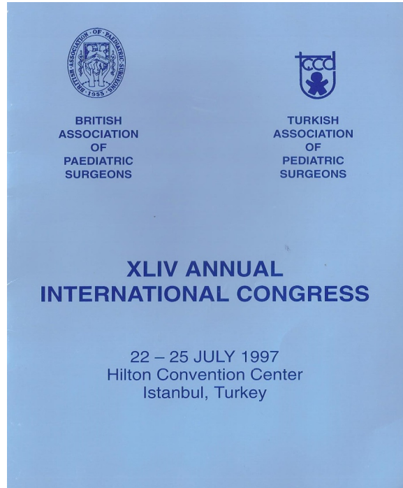
Resim 3. 22-25 Temmuz 1997 tarihinde İstanbul Hilton Kongre Merkezi'nde BAPS ile ortak yapılan kongrenin kitapçığı.

Mensuplarımız, kongrelerimizde ve Uluslararası kongrelere katılarak bilgi ve yetkinliklerini kanıtlamaları yabancı meslektaşlarının da dikkatlerinden kaçmadı. Bu nedenle çeşitli ülkelerden ortak kongre yapma teklifleri geldi. İlk uluslararası toplantı, 9. Çocuk Cerrahisi Kongresi ve Dünya Çocuk Cerrahileri birlikte (WO-FAPS), 28 Ağustos-2 Eylül 1989 tarihinde İstanbul'da Hilton Kongre Merkezinde yapıldı. Daha sonra 15. Çocuk Cerrahisi Kongresi, 21-22 Temmuz 1997 tarihinde İstanbul'da aynı merkezde İngiliz Çocuk Cerrahileriyle (BAPS) birlikte yapıldı (Resim 3). 20. Çocuk Cerrahisi