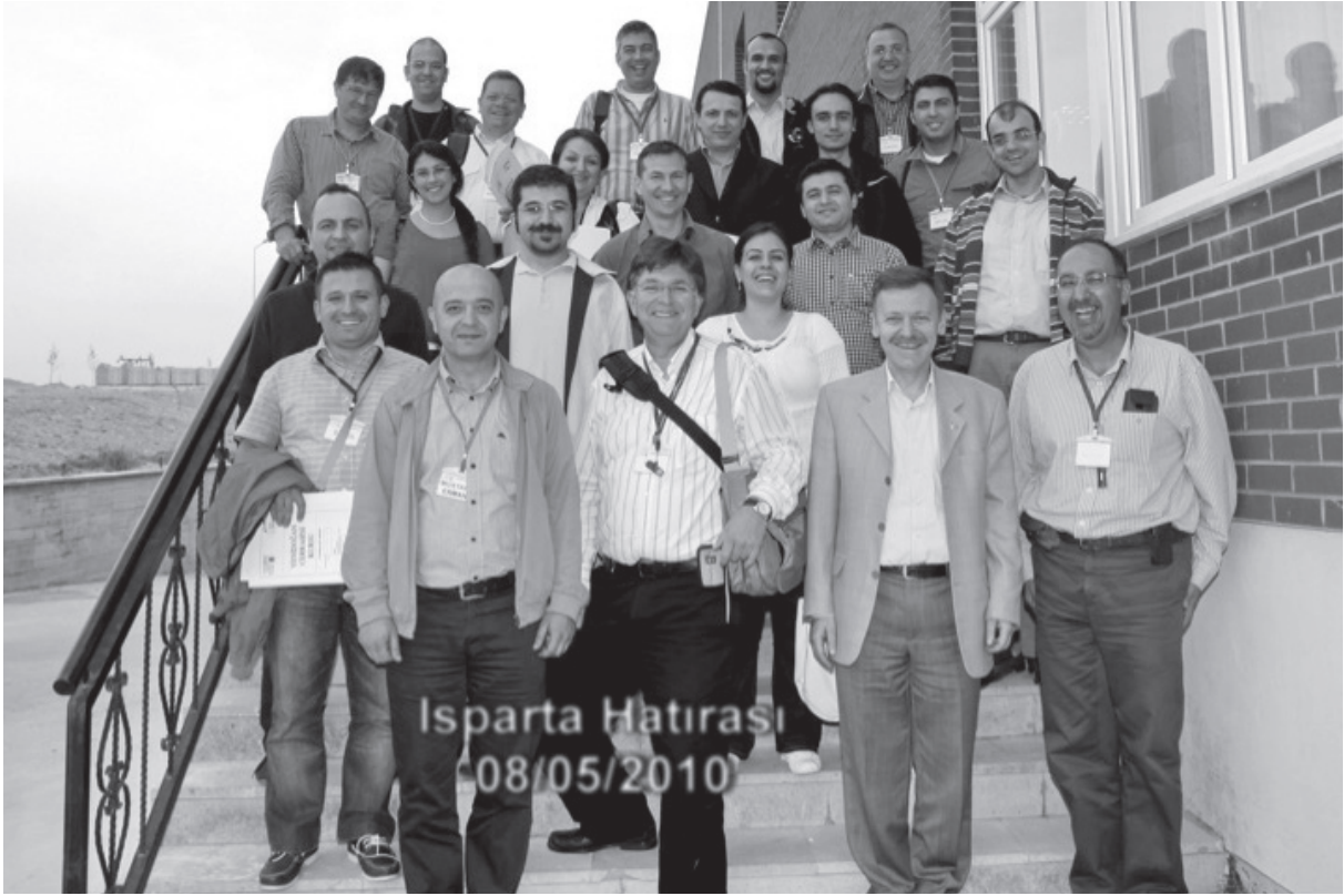
Resim 5. Isparta Süleyman Demirel Üniversitesinde gerçekleştirilen Yenidoğan Cerrahisi kursu katılımcıları (Çocuk Cerrahisi Dergisi 31(3):81-88, 2017).