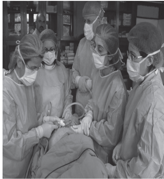
Resim 8. Çocuklarda ileri endoskopik cerrahi kursu, 2010, Ankara (Çocuk Cerrahisi Dergisi 31(3):81-88, 2017).

Türkiye Çocuk Cerrahisi Derneğimiz, Türkiye'de Çocuk Cerrahisine önemli katkılarda bulunmuş hocalarımıza vefa borcu olarak, isimlerini yaşatmak ve genç araş-