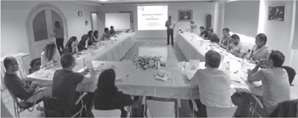
Resim 7. Teorik interaktif ders, 2017, Adana (Çocuk Cerrahisi Dergisi 31(3):81-88, 2017).

2008 yılında Şişli Etfal Hastanesi Çocuk Cerrahisi Kliniği ilk ulusal eşyetkilendirme (Akreditasyon) belgesini aldı (5) .