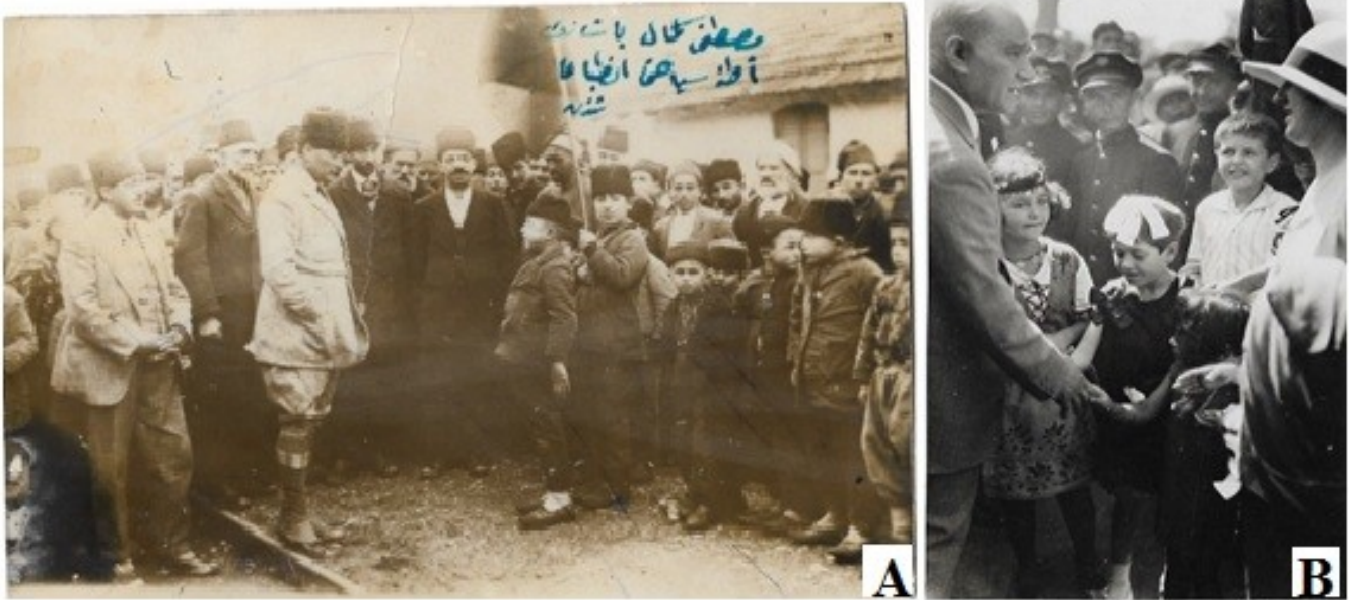
Resim 11: (A) Bilecik, 16 Ocak 1923 (B) Pendik, 16 Ağustos 1929

Çocukları çok seven, her gittiği yerde bu nedenle de çocuklar ve öğrenciler tarafından alkışlanan Atatürk (Resim11), sadece bizlerin değil tüm dünya çocuklarının da Atatürk'ü olmayı başarmıştır (5-7) . Çanakkale'de yaşamlarını yitiren ANZAC askerlerinin annelerinin de ona Atatürk diye hitab etmeleri boşuna değildir.