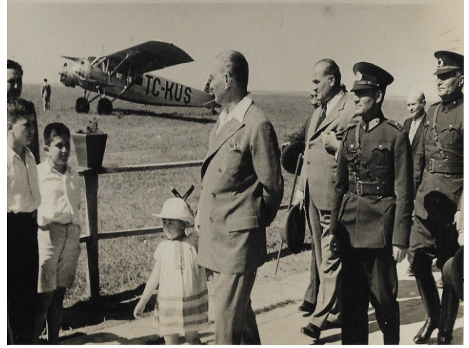
Resim 7: Ülkü ile Florya'da Türk Kuşu ziyaretleri

rol modeli olmuştu. Aynı zamanda affedici, uzlaşıcı bir babaydı. Anzaklı annelerin de ifadesiyle onların da atasıydı (5-7,18-20) .