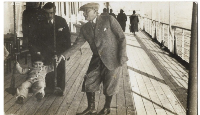
Resim 8: 17 Şubat 1936 İzmir gemisinde Ülkü ve çocuk Atatürk