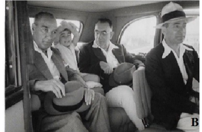
Resim 5: (A) 22 Temmuz 1936'da Florya'da İsmet İnönü ve küçük Ülkü ile (B) 26 Haziran 1935'de İstanbul'da Nuri Conker ve Ülkü ile

Abdurrahim, Afife, Zehra, Rukiye, Nebile, Mustafa, Sabiha Gökçen, Afet İnan ve Ülkü. Genellikle küçük çocuk ağlamasını çok sevmemesine karşın Ülkü'yü bebek hali ile bile sevmiş ve istemişti (3,5-7,17,18) (Resim 5).