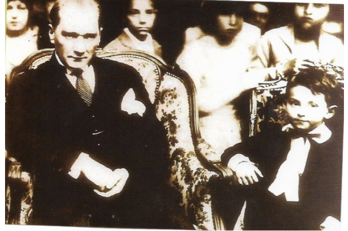
Resim 3: Ankara Palas'ta 1929'daki baloda Atatürk ve büyük olasılıkla küçük Ömer İnönü

katılmışlardır. Bu olay basında geniş yer bulmuştur (5-7,12,13) (Resim 3).