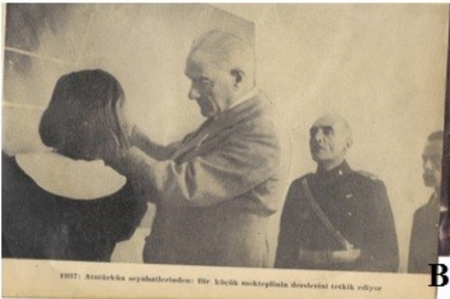
Resim 10: (A) Okul ziyaretleri İzmir Erkek Lisesi, 1925 (B) Derste kız öğrenci ile, 1937

-13 Kasım 1937 tarihinde Atatürk Sivas Lisesini ziyaret etmişti. Bu gezide bir ara 9A sınıfının hendese (geometri) dersine girdiler. Bir kız öğrenci kesişen iki ayrı paralel çizginin aralarında kalan açıları isimlendirirken Arapça kelimelerde