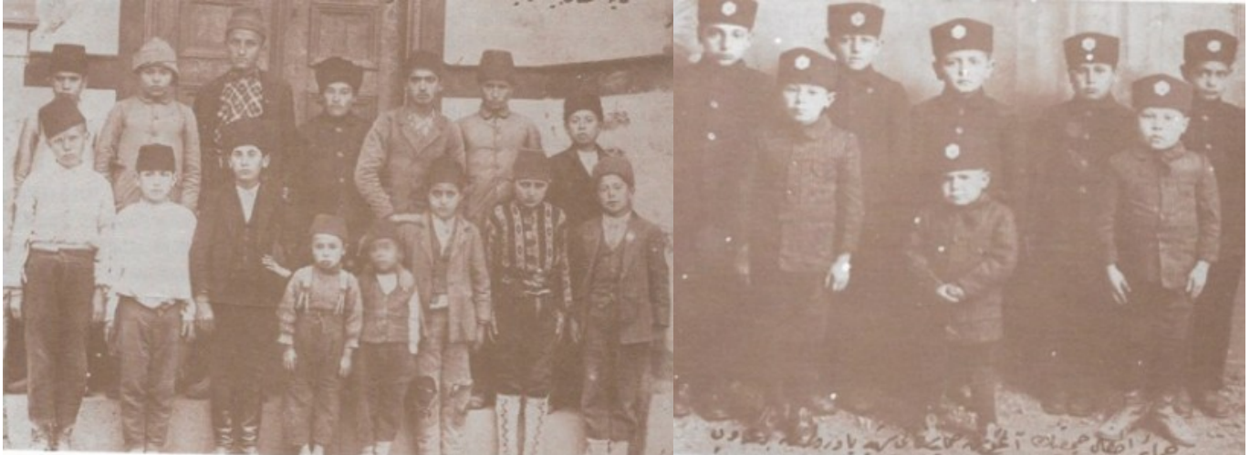
Resim 1. Himaye-i Etfal şehit yetimleri

Bu nedenle, Mustafa Kemal savaştan hemen sonra Maarif Vekili Hamdullah Suphi Bey'i çağırarak bakım ve eğitimleri için bu kapsamdaki çocukların bir çatı altında toplanmalarını istemiştir. Bunun için en kısa sürede girişim başlatılarak Balmumcu Kışlası, bir zamanlar Zincirlikuyu'da bulunan Yapı Meslek Usta Okulu Binası, Maarif Bakanlığı'nca satın alınarak adına Darüleytam "Yetimler Yurdu" dendi. Daha sonra, Ortaköy'deki Galatasaray Lisesi kız bölümünün yer aldığı Feriye Sarayı binası da yetim kız çocukları yurdu yapıldı ve bu yurtların tümünde eğitime de başlandı. Himaye-i Etfal adıyla 30 Haziran 1921'de kurulan bu cemiyet daha sonra 1935'de Çocuk Esirgeme Kurumu adını alarak